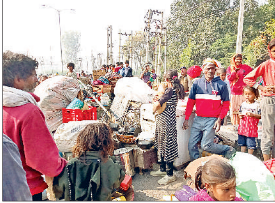
हिस्सार। झुगियां हटाने के बाद सामान के साथ खड़े झुगियों में रहने वाले लोग व झुगियों को गिराती जैसीबी।