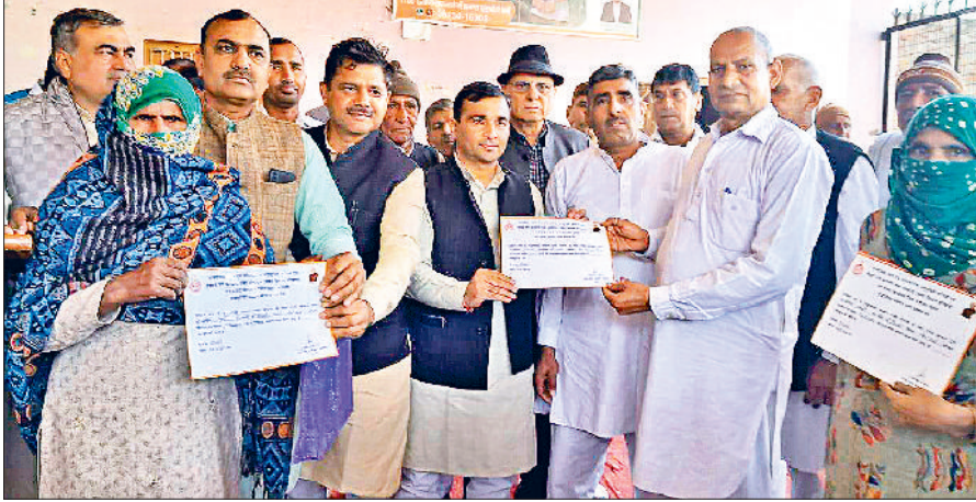
नारनौद। प्रधानमंत्री उज्वला योजना के पात्र परिवारों को प्रमाण-पत्र देते मुख्यातिथि अजय सिंधु।

भाजपा नेता अजय सिंधु ने कहा कि केंद्र तथा राज्य सरकार द्वारा लागू की गईं तमाम योजनाओं का पात्र व्यक्ति लाभ उठाकर भारत को विकसित राष्ट्र बनाने के संकल्प को साकार करने का काम करें। भाजपा नेता अजय सिंधु बुधवार को विकसित भारत संकल्प यात्रा के अंतर्गत कोथ कलां तथा कोथ खुर्द गांव में आयोजित जन संवाद कार्यक्रम में बतौर मुख्यातिथि विशाल जन समूह को संबोधित कर रहे थे। इससे पूर्व उन्होंने दोनों गांव में विकसित भारत जन संकल्प यात्रा का स्वागत किया। उन्होंने अपने संबोधन में आगे कहा कि