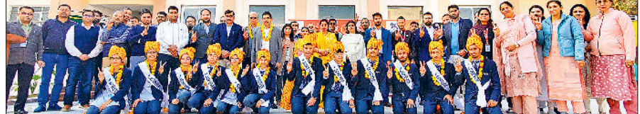
महेंद्रगढ़। वलैट की परीक्षा उत्तीर्ण करने वाले विद्यार्थी।

निगम कर्मचारी के पुत्र को कांस्य पदक प्राप्त होने पर निगमायुक्त ने दी बधाई