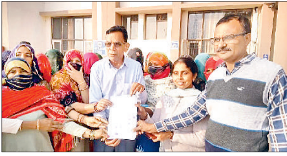
बरवाला। एसडीएम कार्यालय में ज्ञान सौंपते गांव मतलोदा के ग्रामीण।

पर भी जाकर अपनी पत्नी की मार पिटाई करते हैं और घर के बच्चे भी डरे हुए व सहमे सहमे रहते हैं। आक्रोशित ग्रामीणों ने प्रशासन से गांव मतलोदा में शराब का ठेका