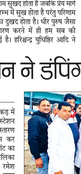
बताया कि इस डंपिंग स्टेशन प्लांट की 20 लाख रुपये की लागत से चारदीवारी निकलवा दी गई है। नगरपालिका की कुल 50 लाख रुपये की लागत आरंभ होगी। ठेकेदार द्वारा 20 लाख रुपये की लागत से डंपिंग स्टेशन प्लांट स्थापित किया गया है।