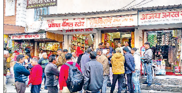
हिस्सार। चोरी वारदात के बाद मौके पर दुकानदार व पुलिस।

टंड बढ़ने के साथ ही चोरी की वारदातें भी बढ़ने लगी हैं। चोरों ने शहर की लाजपत राय मार्केट में दो दुकानों में चोरी की वारदात को अंजाम देते हुए लाखों रुपये की नकदी पर हाथ साफ कर दिया। सूचना मिलने पर पुलिस मौके पर पहुंची और छानबीन में जुट गई। पुलिस आसपास लगे सीसीटीवी कैमरों की फुटेज खंगालने में लगी है। उधर, मार्केट में चोरी की बढ़ती वारदातों को लेकर दुकानदारों में भारी रोष है। दुकानदारों का कहना है