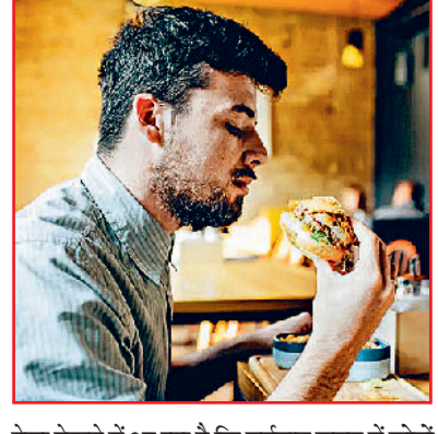
ऐसा देखने में आ रहा है कि वर्तमान समय में लोगों को किडनी स्टोन की समस्या का सामना अधिक करना पड़ रहा है। यूरिन में कैल्शियम की अधिक मात्रा, शरीर में मिनरल्स की कमी, जंक फूड का सेवन और कम मात्रा में पानी पीना किडनी स्टोन के मुख्य कारण माने जाते हैं। इनमें कैल्शियम स्टोन और यूरिक एसिड स्टोन के मरीजों की संख्या अधिक होती है। पैंक्रियास में होने वाले स्टोन का मुख्य कारण, अधिक शराब का सेवन को माना जाता है। इसके अलावा स्मॉकिंग और निकोटिन का सेवन, उच्च वसा और उच्च प्रोटीन युक्त भोजन, वंशानुगत कारक और संकीर्ण या ब्लॉकड पैंक्रियास ट्रेक्ट के कारण भी पैंक्रियास में पथरी का विकास हो सकता है। स्लाइवरी ग्लैंड में पथरी एक दुर्लभ प्रकार की पथरी है। यह पथरी डिहाइड्रेशन, खराब खान-पान, एबॉर्मल ब्लड