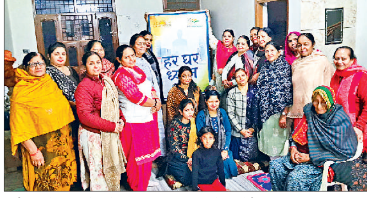
हांसी। हुडा सेक्टर -6 में आयोजित हर घर ध्यान कार्यक्रम में भाग लेती महिलाएं।