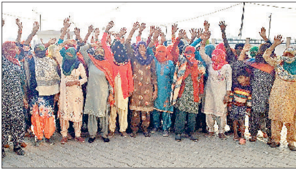
बरवाला। एसडीएम कार्यालय के समक्ष धरना प्रदर्शन करती महिलाएं।

गांव मतलोदा के सैकड़ों की तादाद में ग्रामीणों विशेषकर महिलाओं ने गांव में शराब का ठेका व अवैध खुदों को बंद करवाए जाने की मांग को लेकर एसडीएम कार्यालय के समक्ष धरना प्रदर्शन किया। इस दौरान एसडीएम के नाम ज्ञान सौंपा। इस धरना प्रदर्शन में इन आक्रोशित ग्रामीणों ने सरकार व प्रशासन के खिलाफ नारेबाजी की। प्रदर्शन में शामिल ग्रामीणों